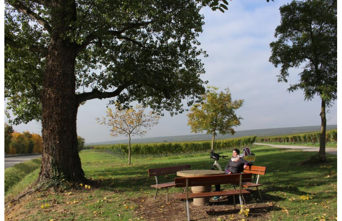
Rast am Mühlen-Radweg