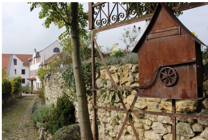
Die Kaiserbad-Mühle in Westhofen