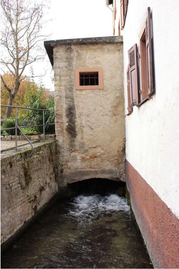
Zahlreiche Mühlen liegen am Wegesrand