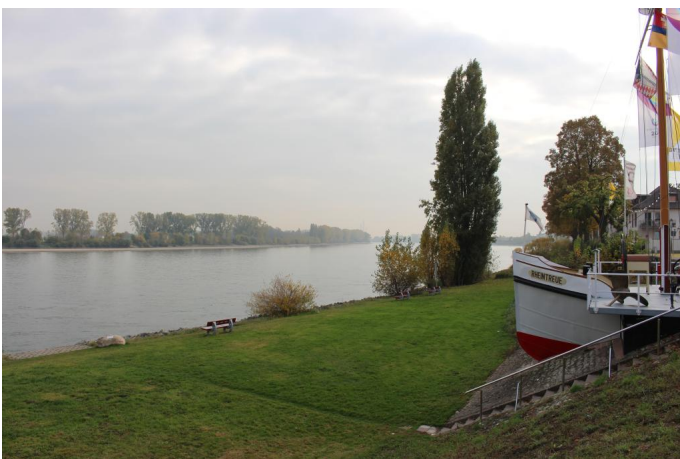
Ausblick auf den Rhein in Rheindürkheim