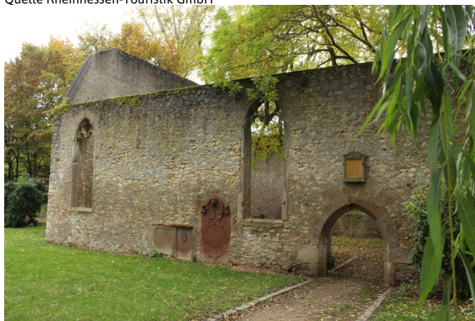
Die Ruine der Liebfrauenkirche in Westhofen