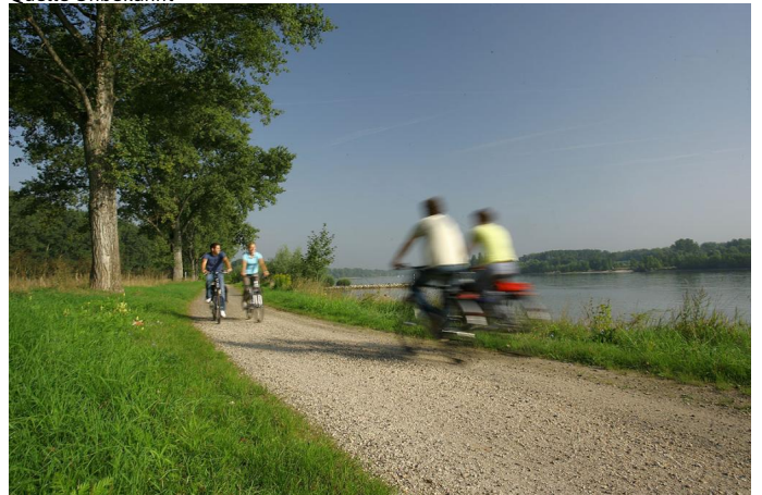
Der Rheinradweg zwischen Worms und Bingen