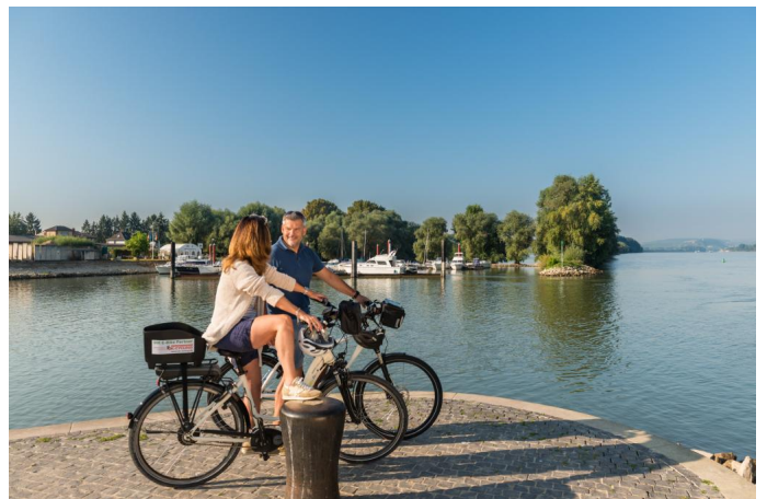
Toller Blick ins breite Rheintal an der Ingelheimer Mole