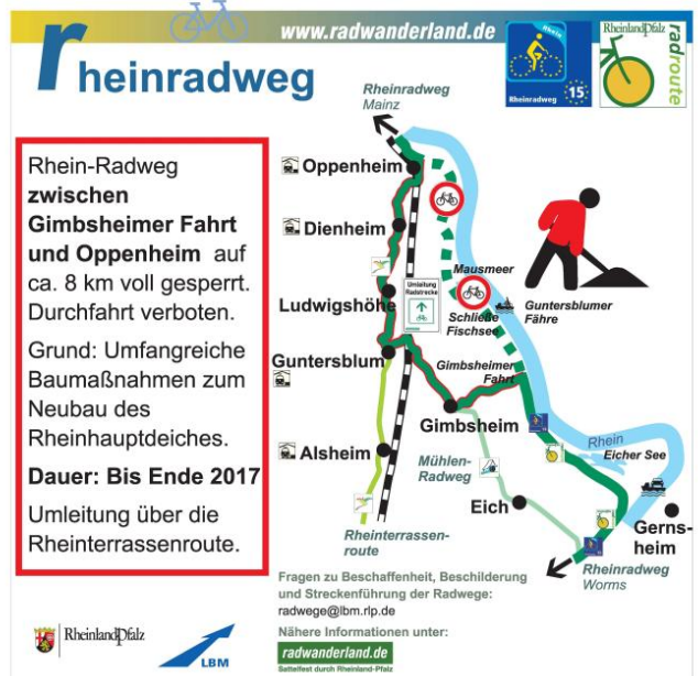
Umleitung Oppenheim - Gimbsheim