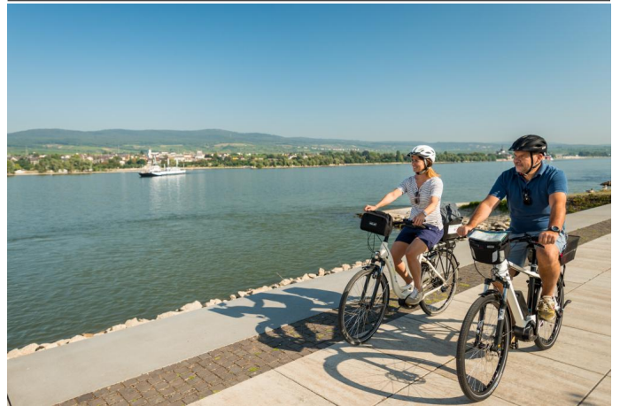
Der Rheinradweg in Rheinhessen